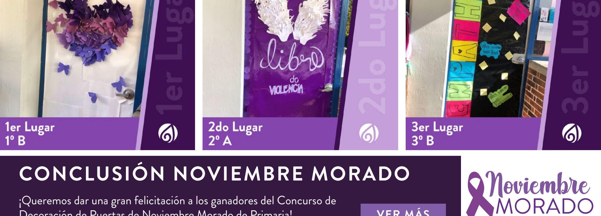
1er Lugar 1º B

Tengan su cartilla de vacunación al día.